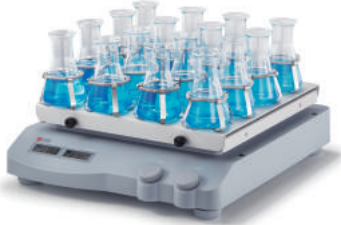
SK-O330-Pro / SK-L330-Pro / SK-R330-Pro (With non-slip mat)