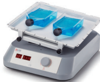
SK-O180-S / SK-L180-S / SK-R1807-S (With non-slip mat)