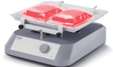
SK-O180-E / SK-L180-E / SK-R1807-E (With non-slip mat)