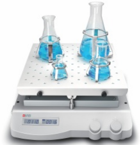
SK-R330-Pro (rocking shaker)