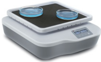
SK-0180-S (orbital shaker)