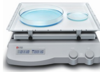
SK-L330-Pro (linear shaker)