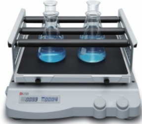
SK-0330-Pro (orbital shaker)